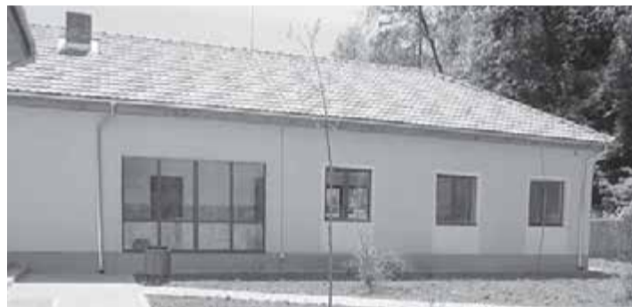
After school - Pietroasa

- Ce investiții s-au făcut în ultimul an pe raza comunei Pietroasa și ce va urma în 2014?