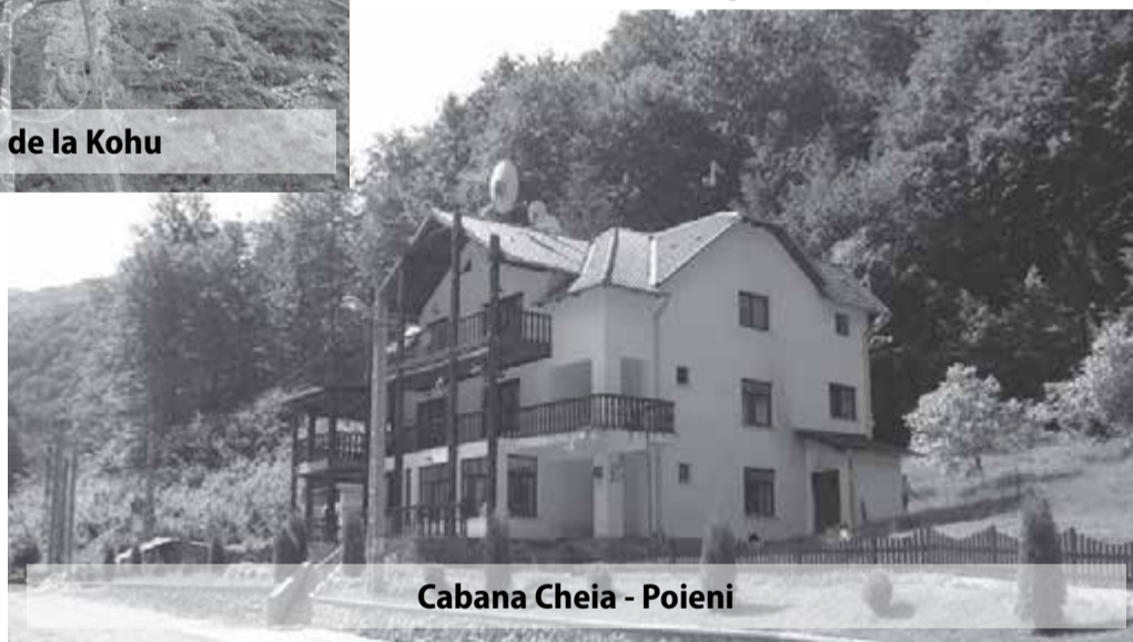
Cabana Cheia - Poieni

Ioan Simoc: Având în vedere condițiile naturale ale comunei, de bun augur pe viitor ar fi valorificarea bogățiilor subsolului, în special a calcarului folosit pentru întreținerea infrastructurii și pentru obținerea varului. Alte soluții sunt valorificarea lemnului prin producerea de cherestea și mobilă, extinderea activității de recoltare a plantelor medicinale și a fructelor