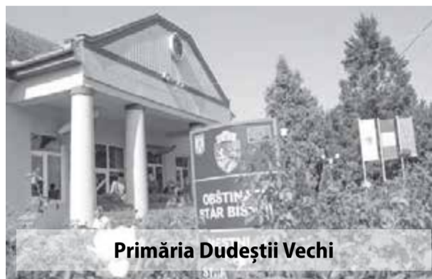
Primăria Dudeștii Vechi

- Ce investiții s-au făcut în ultimul an pe raza comunei Dudeștii Vechi și ce va urma în perioada următoare?