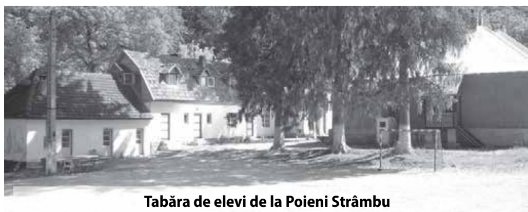
Tabăra de elevi de la Poieni Strâmbu